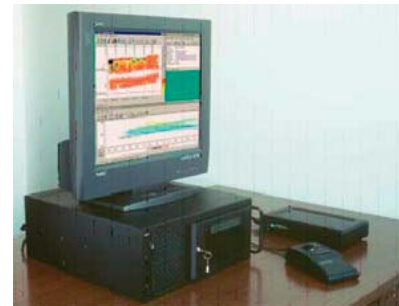
Система збору і відображення даних

Крім цього, за результатами гідрографічної зйомки, виконаної SeaBat 8101, можна надавати звітні матеріали як у традиційному вигляді (планшети з ізобатами і відмітками глибин), так і у вигляді тривимірних зображень з відповідним позарамковим оформленням.