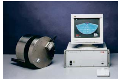
Бортове обладнання і підводний блок SeaBat 8101

SeaBat 8101 виконує 40 сканувань за секунду, при чому кожне сканування надає дані по 101 променю. За рахунок використання великої кількості променів з вузькою діаграмою направленості (1,5 градуса) і великою частотою випромінювань, він дозволяє покрити велику площу дна при скануванні за одиницю часу з дуже високою роздільною здатністю.